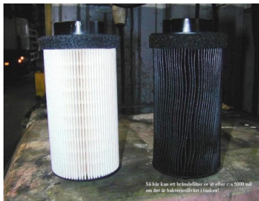
50 liter diesel med bränslefilter av 10 liter ca 5000 ml av det är bakterietillväxt i tanken.

Använder du Bio-Protect 2 så undviker du de där problemen!